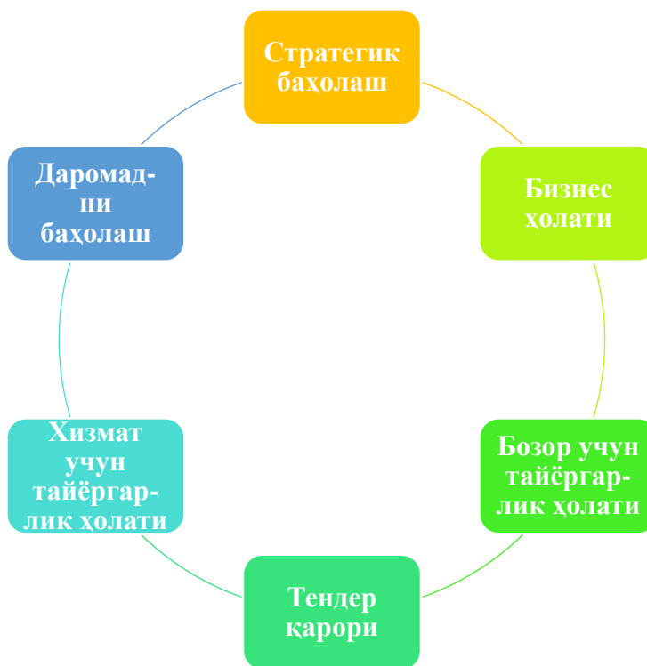
1-расм. Gateway Review Process (GRP) усули босқичлари 221

Шуни таъкидлаш керакки, лойиҳани ривожлантириш ва “due diligence” жараёни лойиҳага ёки инвестиция ҳаётининг циклига янги фаолиятларни қўшиш учун мўлжалланмаган, балки лойиҳа муваффақияти имкониятларини ошириш учун лойиҳанинг қайси босқичида қайси фаолиятни кўриб чиқиш кераклиги ҳақида кўрсатма беради. Якуний лойиҳа режасида лойиҳа ташаббускори тегишли лойиҳани ривожлантириш ва “due diligence” жараёнини ўтказишнинг даражасини ва элементларини танлайди.