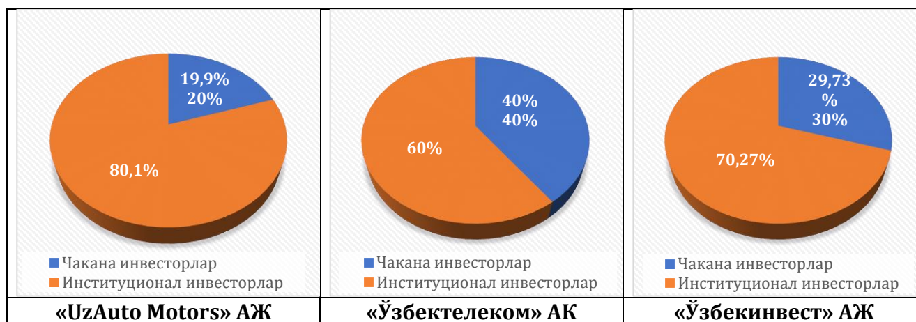
2-расм. 2023 йилда IPO орқали сотилган акцияларнинг институционал ҳамда чакана инвесторларга тақсимои 178

«Ўзкимёсаноат» АЖ маълумотида кўра, «Жиззах пластмасса» АЖ устав капиталининг 25% миқдордаги улуши IPO орқали амалга оширилади, бу эса 1 140 246 дона акцияни ташкил этади. Акциялар жойлаштирилгандан сўнг акциялар умумий сони 5 701 231 донага етади. Бир киши 11 402 дона акцияларни сотиб олиши мумкин, бу таклифнинг 1 фоизини ташкил этади («Ўзкимёсаноат» АЖ, 2020).