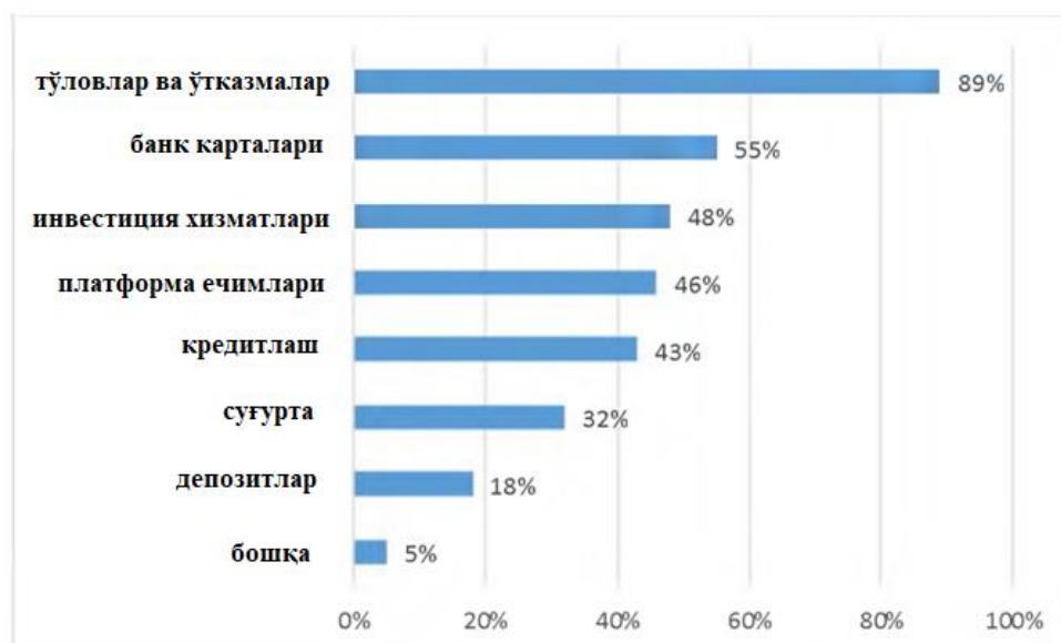
1-расм. Рақамли технологияларни қабул қилиш даражасига кўра банк хизматларини тақсимлаш (респондентларнинг умумий сонидан%)

Бозор кредит ташкилотлари фаолиятига қўйиладиган талабларни янгилайди, бу еса мижоз учун қизиқарли бўлган янги банк операциялари учун ечимларни излашга олиб келади (1-расм). Олий Иқтисодиёт мактаби тадқиқотчилари рақамлаштиришнинг банк сектори ривожланишига таъсирини баҳолаш учун сўров ўтказдилар. Ушбу сўров натижаларига кўра, “Финтеч ечимлари енг кўп талаб қилинадиган банк хизматлари” тўловлар ва ўтказмалар тоифасига киради (респондентларнинг 89% га кўра). “Банк карталари” (55%), “инвестиция хизматлари” (48%), “платформа ечимлари” (46%), шунингдек “кредитлаш” (43%) тоифалари ўртача талабга ега бўлди. Финтечни жорий етиш учун банк хизматларининг енг кам талаб қилинадиган турлари “суғурта” (32%) ва “депозитлар” (18%) (2-расм). Шу сабабли, инновацион сиёсат банк фаолиятининг максимал рентабеллигига еришиш учун хатарларнинг мақбул даражасини аниқлаш ва қабул қилишга асосланган. Хизматларнинг долзарблиги ва банк секторига инновацион технологияларни жорий етиш масаласи муҳим ва устувор масала ҳисобланади. 1-расм. Рақамли технологияларни қабул қилиш даражасига кўра банк хизматларини тақсимлаш (респондентларнинг умумий сонидан%).